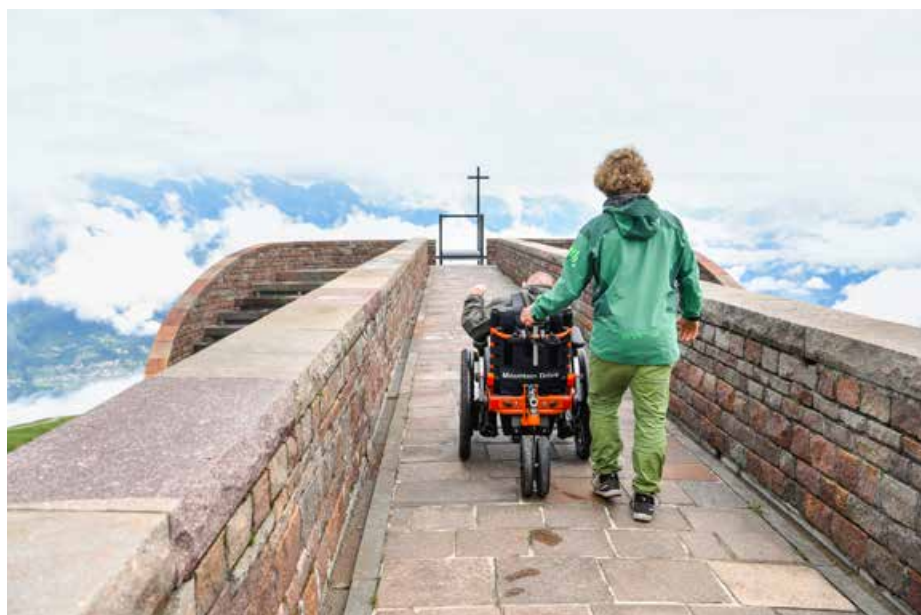
L'église Santa Maria degli Angeli peut elle aussi être visitée en JST.

Nous tenons d'ailleurs à remercier chaleureusement nos nombreux partenaires locaux de l'aide indéfectible qu'ils nous apportent pour les locations.