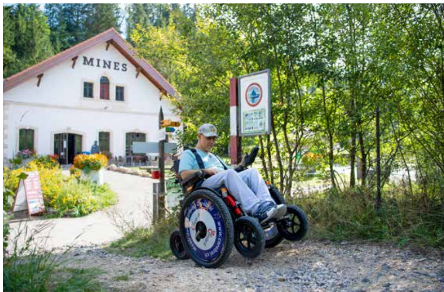
Le fauteuil roulant électrique tout-terrain de la Fondation Cerebral permet aux personnes en situation de handicap d'accéder aux mines et au beau jardin naturel.

Pour permettre aux personnes en situation de handicap et à leurs familles de découvrir le Val-de-Travers par leurs propres moyens, nous avons aussi mis en place, en collaboration avec la Fondation Cerebral, une station de location de vélos adaptés. Celle-ci se trouve juste à côté des Mines d'asphalte, et les personnes peuvent choisir, parmi trois types de vélo, celui qui leur convient le mieux. Tous équipés d'un moteur électrique, ils permettent de faire de longues promenades.