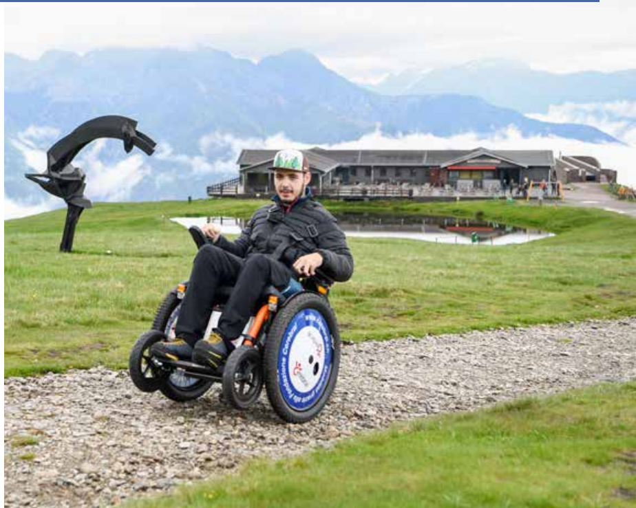
La nouvelle station de location se trouve sur l'Alpe Foppa (à l'arrière-plan).

Pour permettre aux personnes à mobilité réduite de découvrir ce site, nous avons mis en place, en collaboration avec le Monte Tamaro, une station de location de fauteuils roulants électriques tout-terrain JST.