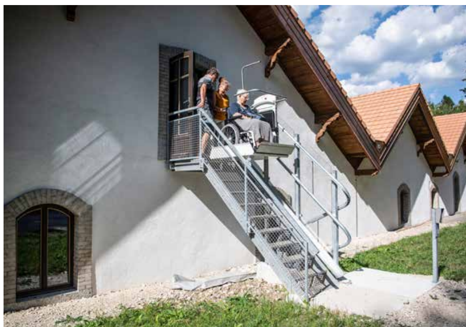
Grâce à un monte-escaliers récemment installé, on peut parcourir les Mines d'asphalte à la découverte de l'histoire de son extraction en Suisse.

Pour l'instant, nos offres sans barrière sont surtout destinées aux personnes seules et aux familles, mais nous souhaitons à l'avenir les étendre aux groupes de plusieurs personnes à mobilité réduite.